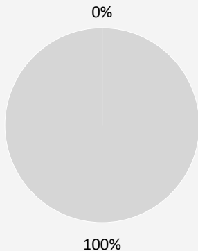
1. Taxonomie-Konformität der Investitionen einschließlich Staatsanleihen*

■ Taxonomiekonform ■ Andere Investitionen